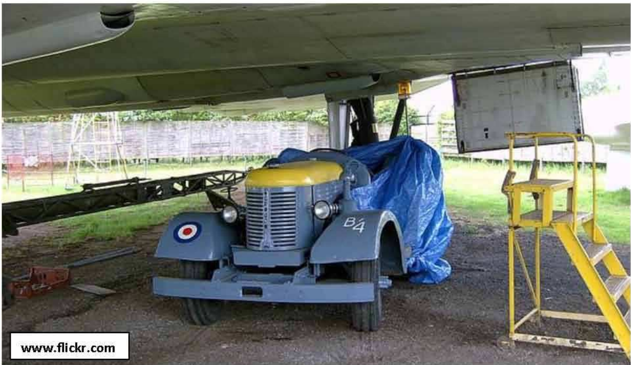
A LANCASTER OF 49 SQUADRON